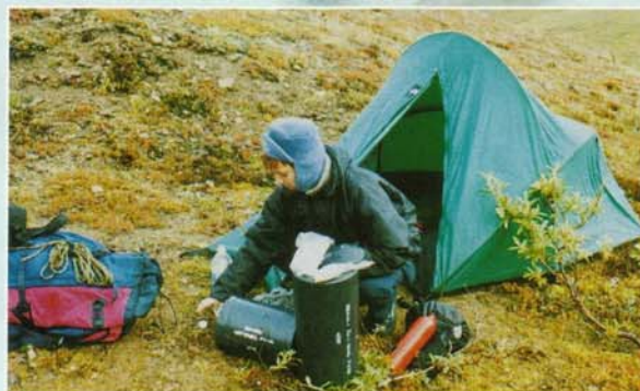
Die umgepackten Behälter mit Eßbarem mußten so untergebracht werden, daß sie keine Bären anzogen.